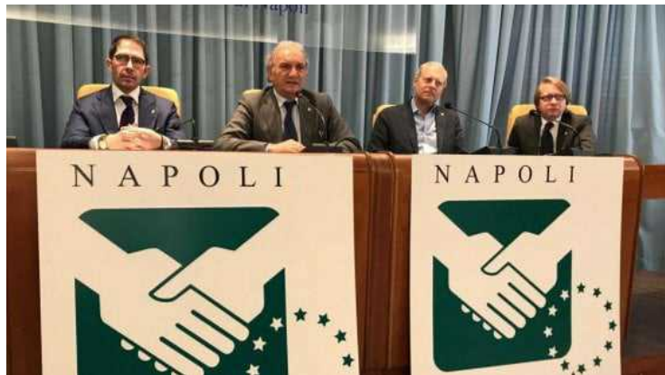
Consiglieri e presidente Fimaa

La Federazione Italiana Mediatori ed agenti d'Affari di Napoli, impegnata a tutelare i diritti dei propri associati, pone al centro della propria "mission" anche il consumatore e le sue aspettative e lancia la tessera ID Quality